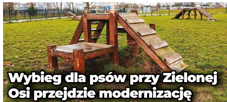
fol. FB/Lukasz Walczak