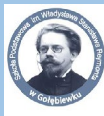
SP w Gołębiewku