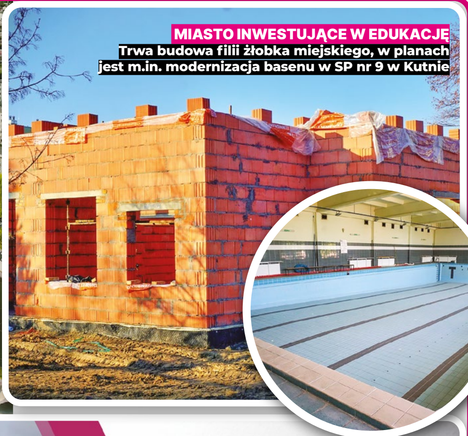
MIASTO INWESTUJĄCE W EDUKACJĘ Trwa budowa filii żłobka miejskiego, w planach jest m.in. modernizacja basenu w SP nr 9 w Kutnie

M.S. Dziękuję bardzo i pozdrawiam wszystkich czytelników. •