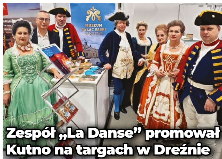
fol. Muzeum Pałac Saski

Wybieg przy Zielonej Osi to jedno z ulubionych miejsc spacerowych właścicieli psów, a poprawa jego stanu technicznego i bezpieczeństwa z pewnością wpłynie na komfort zarówno zwierząt, jak i ich opiekunów. •