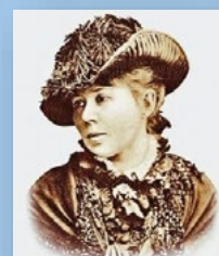
SP w Byszewie