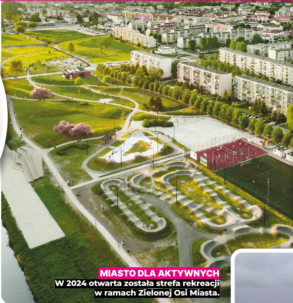
MIASTO DLA AKTYWNYCH W 2024 otwarta została strefa rekreacji w ramach Zielonej Osi Miasta.

mieszkańców m.in.: Zimowa, Polna, Gądomskiego jak i na terenach przemysłowych: Ekonomiczna, Skłęczkowska Bis czy Odlewnicza. Dodatkowo na bieżąco remontowaliśmy chodniki i ulice m.in. fragmenty nakładek asfaltowych na ulicach: Troczewskiego czy Oporowskiej. Rozpoczęliśmy również modernizację kolejnych dróg mam tu na myśli ulice: Kosmonautów oraz Żniwną. Warto zaznaczyć, że inwestujemy również w edukację. Rozpoczęliśmy budowę drugiej filii żłobka Wesoła Łąka, gdzie będzie miejsce dla 58 dzieci. Nasze szkoły podstawowe i przedszkola stawiają na rozwój i otrzymały pieniądze na utworzenie kolejnych ekopracowni. Stawiamy na edukację, bo chcemy, żeby młodzi kutnianie mieli dobre warunki do osobistego rozwoju i zdobywania wiedzy.