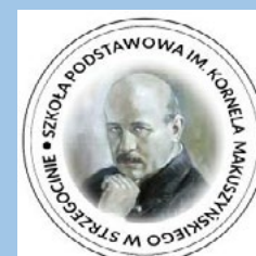
SP w Strzegocinie

W związku z prowadzoną rekrutacją do oddziałów przedszkolnych i klas pierwszych w publicznych szkołach, dla których organem prowadzącym jest gmina Kutno, informujemy: