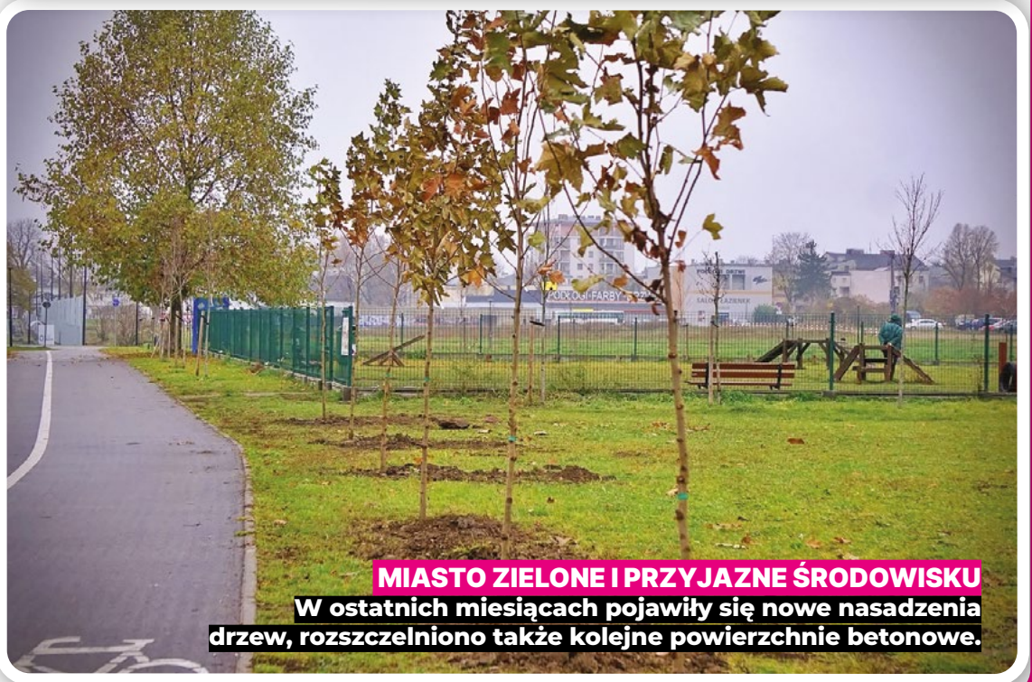
MIASTO ZIELONE I PRZYJAZNE ŚRODOWISKU W ostatnich miesiącach pojawiły się nowe nasadzenia drzew, rozszczelniono także kolejne powierzchnie betonowe.