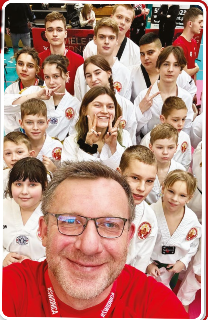
fol. AZS Kutno

Kolejnym wyzwaniem dla kutnowskiej sekcji będą Mistrzostwa Polski Tang-Soo-Do, które odbędą się w kwietniu. Po tak udanym występie w Świdnicy, kibice mogą z optymizmem oczekiwać kolejnych sukcesów sportowców z Kutna! •