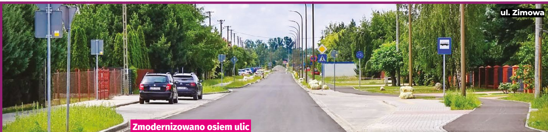
Zmodernizowano osiem ulic