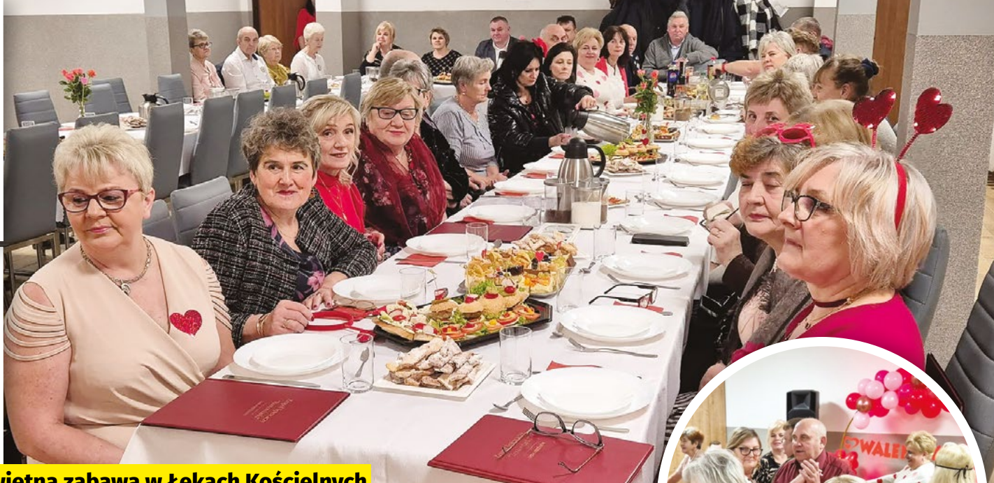
Świetna zabawa w Łękach Kościelnych