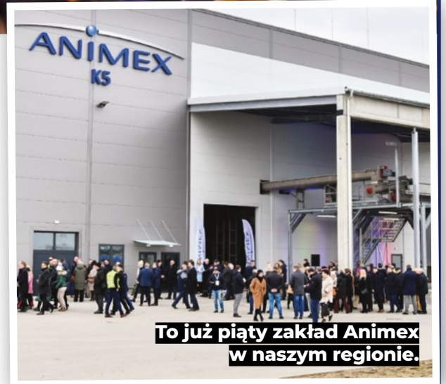
To już piąty zakład Animex w naszym regionie.

Otwarcie Animex K5 to istotny krok w rozwoju gospodarczym regionu, który nie tylko umacnia pozycję firmy na rynku, ale także przyczynia się do wzrostu lokalnej gospodarki i tworzenia nowych miejsc pracy. To kolejna inwestycja, która potwierdza znaczenie regionu kutnowskiego-łęczyckiego na mapie przemysłu spożywczego w Polsce. Przypomnijmy, w Mieście Róż znajdują się trzy zakłady Animex, a kolejne dwa znajdują się we wspomnianych Korytach.