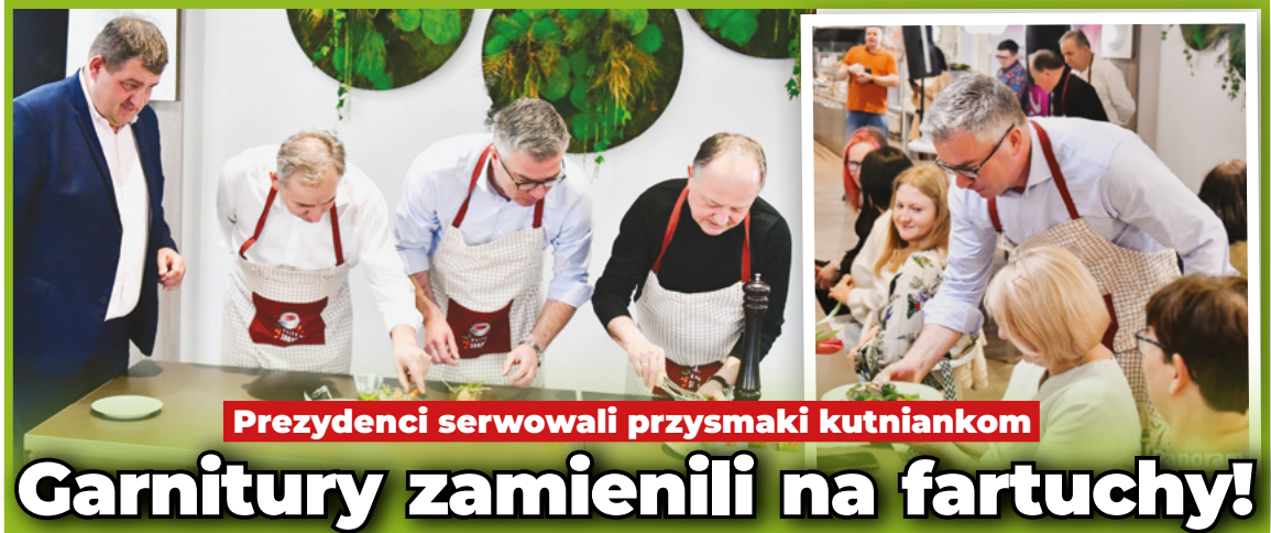
Prezydenci serwowali przysmaki kutniankom

Kutnowski Dom Kultury dziękuje wszystkim uczestnikom, prelegentom oraz partnerom wydarzenia i z niecierpliwością czeka na kolejne edycje! •