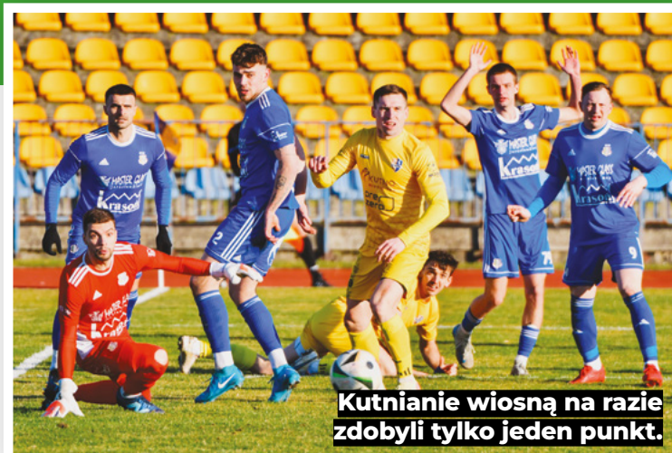
Kutnianie wiosną na razie zdobyli tylko jeden punkt.

Mimo prób w końcówce, piłkarze KS Kutno nie zdołali już jednak odpowiedzieć, a gospodarze dowieźli zwycięstwo do ostatniego gwizdka. Mało tego, czerwona kartką (po dwóch żółtych) ukarany został Piotr