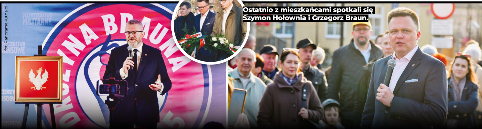
Ostatnio z mieszkańcami spotkali się Szymon Hołownia i Grzegorz Braun.