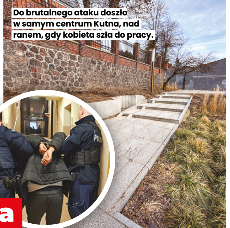
Do brutalnego ataku doszło w samym centrum Kutna, nad ranem, gdy kobieta szła do pracy.