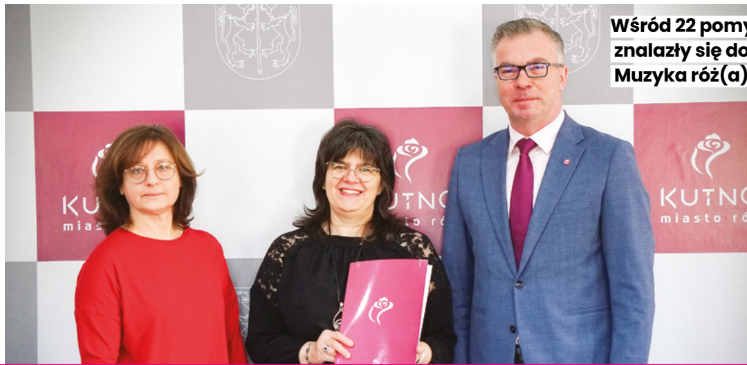
Wśród 22 pomysłów, które otrzymały wsparcie Prezydenta Kutna znalazły się dobrze znane mieszkańcom projekty takie, jak Muzyka róż(a)na w Parku Wiosny Ludów czy Black Rose Fest Kutno.