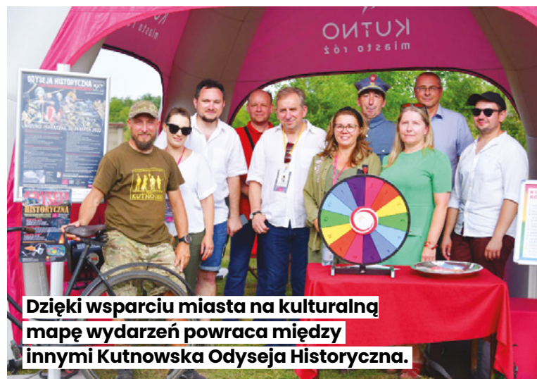
Dzięki wsparciu miasta na kulturalną mapę wydarzeń powraca między innymi Kutnowska Odyseja Historyczna.

22. Kutnowskie Stowarzyszenie Promocji Muzyki – „80 lat gramy dla Was” – Jubileusz PSM I i II st im K. Kurpińskiego w Kutnie – 50 000 zł (pozytywna).