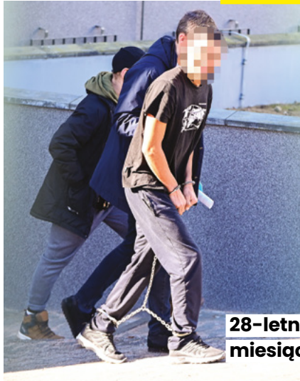
28-letni Kolumbijczyk najbliższe miesiące spędzi w areszcie.