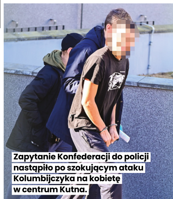
Zapytanie Konfederacji do policji nastąpiło po szokującym ataku Kolumbijczyka na kobietę w centrum Kutna.