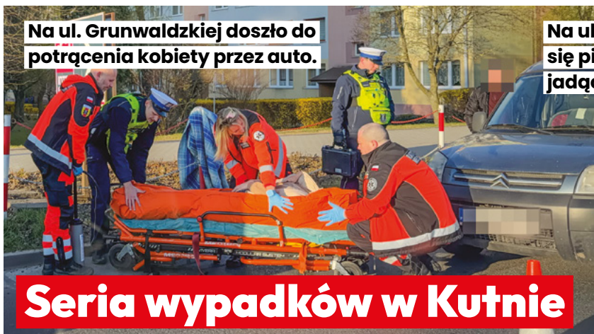
Na ul. Grunwaldzkiej doszło do potrącenia kobiety przez auto.