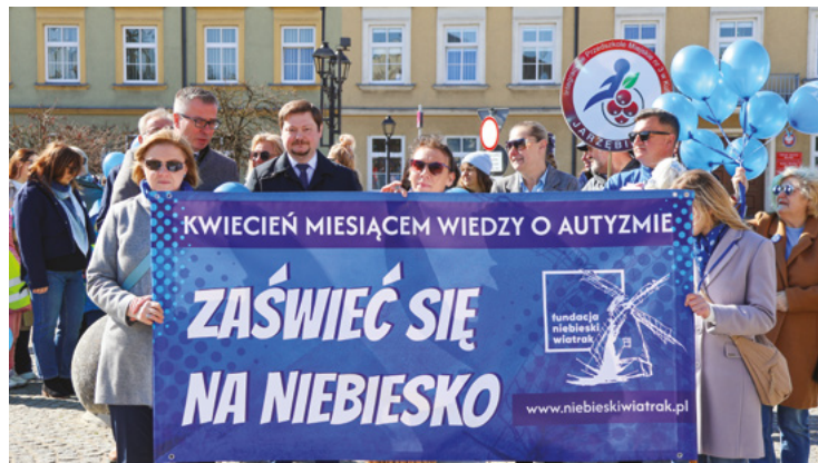
Przez Kutno przeszedł „Marsz na Niebiesko”, inaugurujący obchody Światowego Miesiąca Wiedzy na temat Autyzmu.