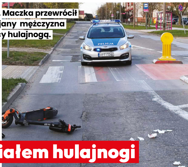
Na ul. Maczka przewrócił się pijany mężczyzna jadący hulajnogą.